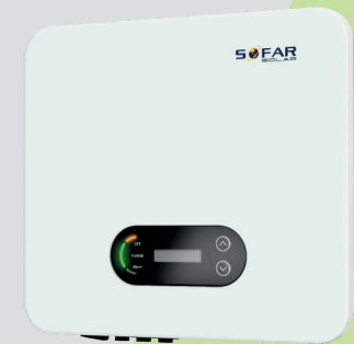
SOFAR Solar- Wechselrichter