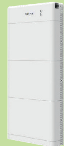
10 kWh Speichersystem

IHR DACH HAT MEHR DRAUF MIT BRALE ENERGY