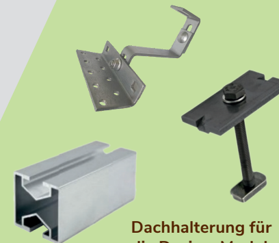
Dachhalterung für die Design-Module